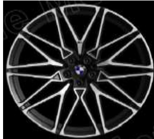
Styling 818 M