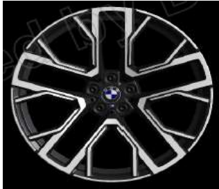
Styling 809 M