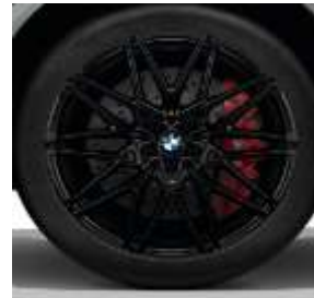
Styling 818M JetBlack