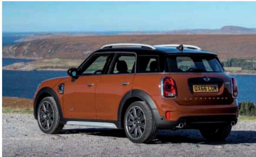
P90240532.jpg / P90240653.jpg

Kontur auf. Die Dachreling in der Ausführung Aluminium satiniert wird mit silberfarbenen Seitenschweller-Aufsätzen kombiniert. Damit wird die Fahrzeughöhe optisch zusätzlich betont. Am Heck dominieren horizontale Linien, zu denen die senkrecht angeordneten Leuchteinheiten einen reizvollen Kontrast bilden.