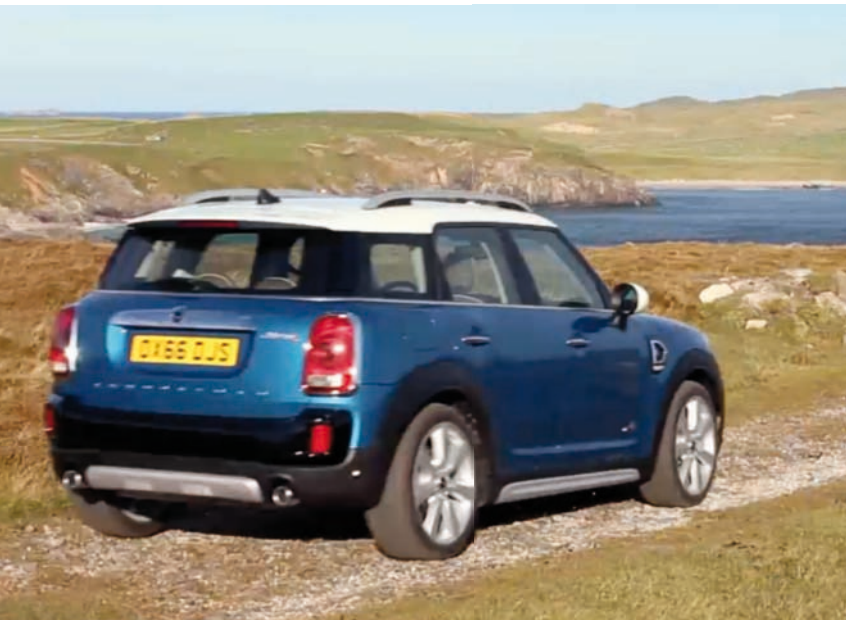
> Film Schottland LINK

Mit ihrer Modellbezeichnung bleibt auch die Neuauflage des MINI Countryman fest