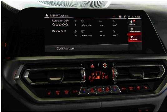
(M 漂移分析&amp;M 圈速计时)