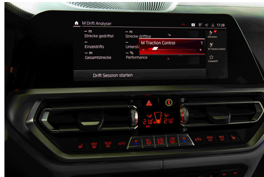
(M 牵引力控制十级调节)

该功能集成了三大硬核科技，为车辆提供了 M 漂移分析、M 圈速计时和 M 牵引力控制调节。通过实际体验，十级可调的 M 牵引力控制调节备受好评。驾驶者可根据自身驾驶技术、路面情况自行选择牵引力等级，可精细的调整车辆的弯道性能，令驾控更具挑战。此外，M 漂移分析与 M 圈速计时器则会分别记录车辆在漂移与赛道竞速过程中的多项数据，令驾驶者可清晰直观的了解车辆动态数据与竞速成绩。